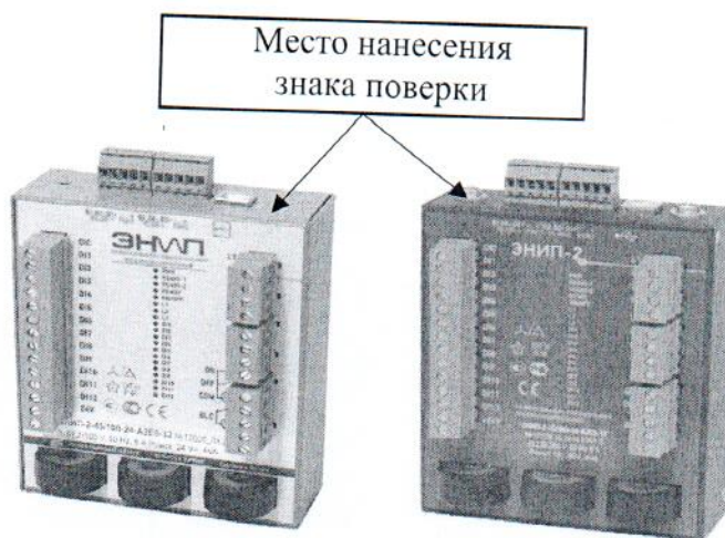
Рисунок 2 – Общий вид преобразователей модификации ЭНИП-2-...-X2