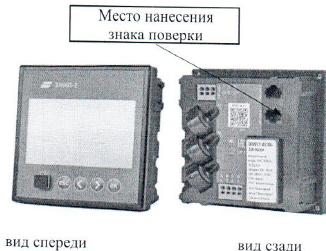
Рисунок 4 – Общий вид преобразователей модификации ЭНИП-2-...-Х4