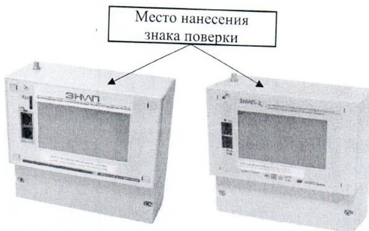
Рисунок 3 – Общий вид преобразователей модификации ЭНИП-2-...-X3