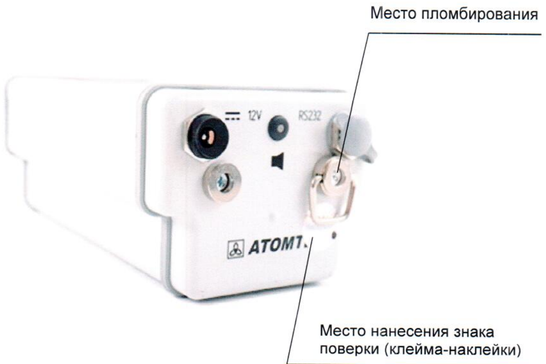
Рисунок 2 – Место нанесения знака поверки (клейма-наклейки)