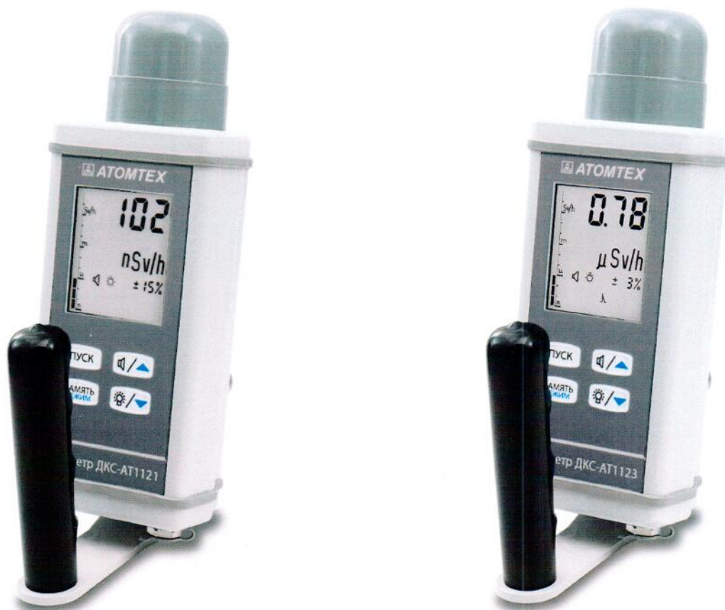
Рисунок 1 – Общий вид дозиметров

Общий вид дозиметров приведен на рисунке 1.