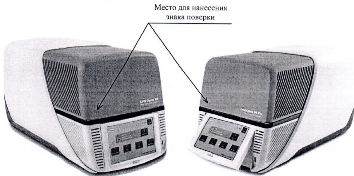
Рисунок 2 – Схема (рисунок) с указанием места для нанесения знака поверки

Схема (рисунок) с указанием места для нанесения знака поверки средства измерений