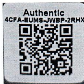
Рисунок 1.2 – Фотография маркировки манометра дифференциального показывающего Magnehelic 2000-500PA № 4CFA-EUMS-JWBP-2RHX