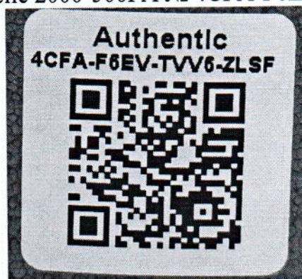
Рисунок 1.2 – Фотография маркировки манометра дифференциального показывающего Magnehelic 2000-500PA № 4CFA-F6EV-TVV6-ZLSF