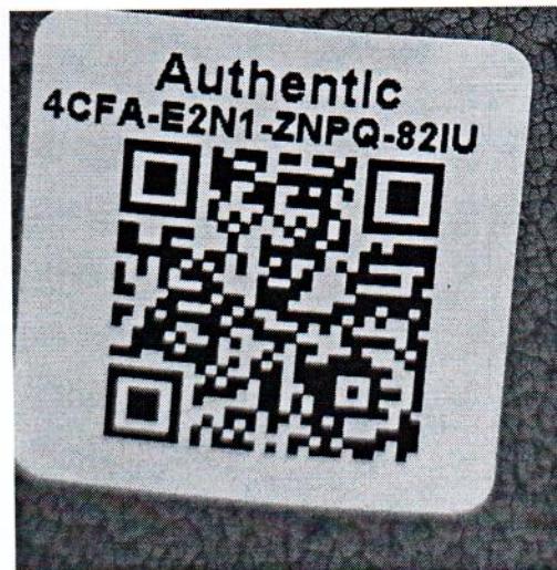
Рисунок 1.2 – Фотография маркировки манометра дифференциального показывающего Magnehelic 2000-500PA № 4CFA-E2N1-ZNPQ-82IU