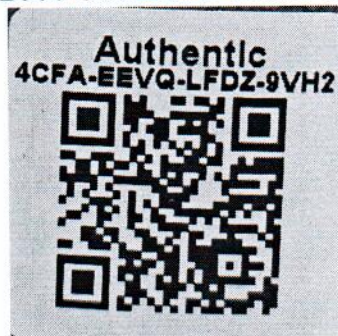
Рисунок 1.2 – Фотография маркировки манометра дифференциального показывающего Magnehelic 2000-500PA № 4CFA-EEVQ-LFDZ-9VH2