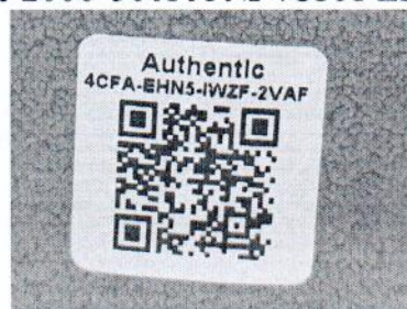
Рисунок 1.2 – Фотография маркировки манометра дифференциального показывающего Magnehelic 2000-500PA № 4CFA-EHN5-IWZF-2VAF