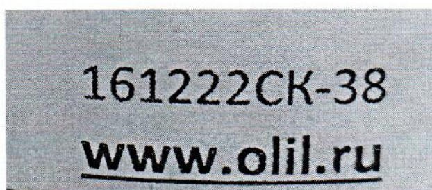
Рисунок 1.2 – Фотография маркировки манометра дифференциального показывающего Magnehelic 2000-60PA № 161222СК-38