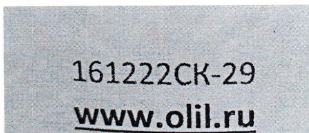
Рисунок 1.2 – Фотография маркировки манометра дифференциального показывающего Magnehelic 2000-60РА № 161222СК-29