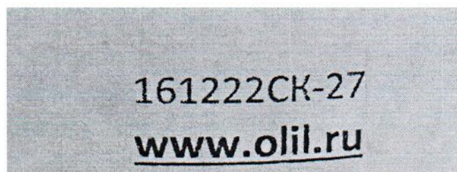
Рисунок 1.2 – Фотография маркировки манометра дифференциального показывающего Magnehelic 2000-60PA № 161222СК-27