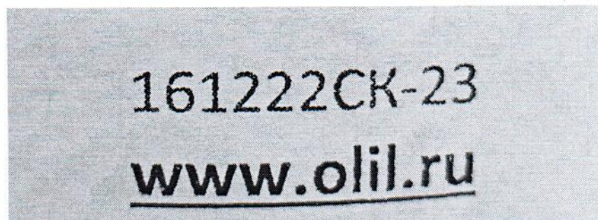
Рисунок 1.2 – Фотография маркировки манометра дифференциального показывающего Magnehelic 2000-60РА № 161222СК-23