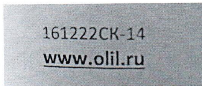
Рисунок 1.2 – Фотография маркировки манометра дифференциального показывающего Magnehelic 2000-60PA № 161222СК-14