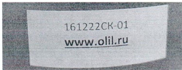
Рисунок 1.2 – Фотография маркировки манометра дифференциального показывающего Magnehelic 2000-60PA № 161222СК-01