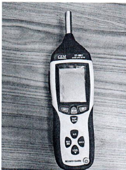
Рисунок 1.1 – Фотография общего вида измерителя уровня звука DT- 8852 № 150301785