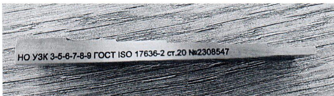
Рисунок 1.2 – Фотография маркировки настроечного образца типа «Ступенька» № 2308547