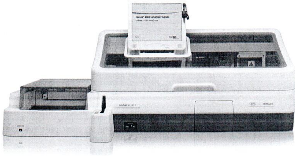
Рисунок 1.1 – Фотография общего вида Анализатора автоматического иммунохимического Cobas e411 № 15B6-28

Фотография общего вида средств измерений