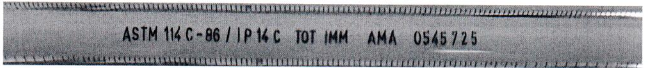
Рисунок 1.2 – Фотография маркировки термометра стеклянного ASTM 114 C № 0545725