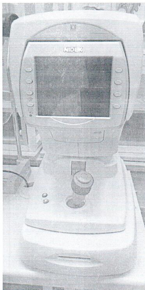
Рисунок 1.1 – Фотография общего вида автоматического рефрактометра-кератометра ARK-510A № 331369