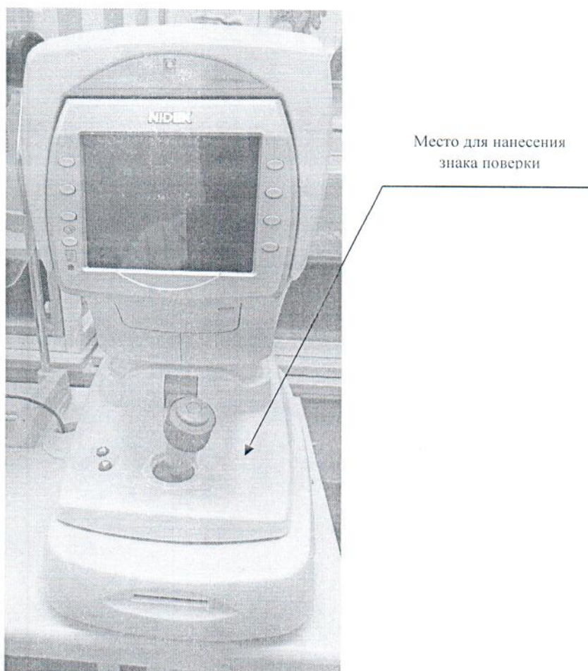
Схема (рисунок) с указанием места для нанесения знака поверки средств измерений