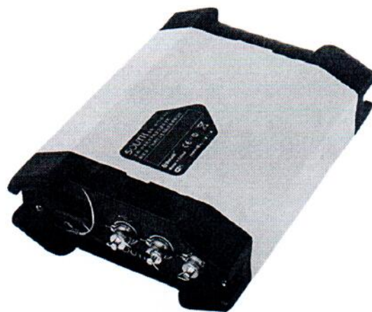
Net S10 mini