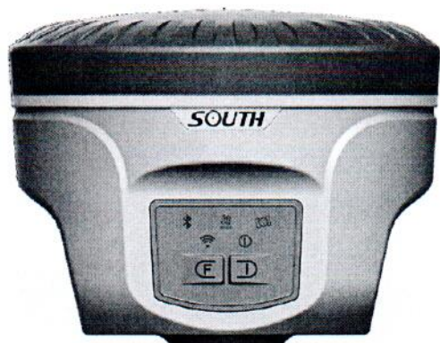
Galaxy G1 plus