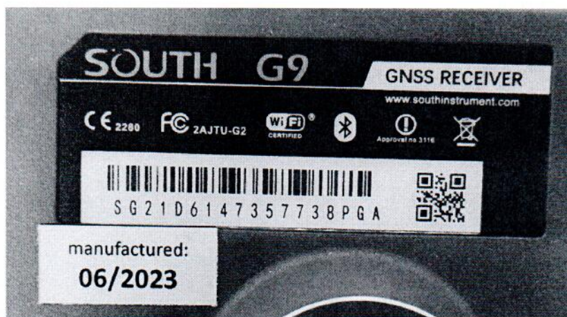
Рисунок 1.3 – Фотография маркировки GNSS-приемников SOUTH