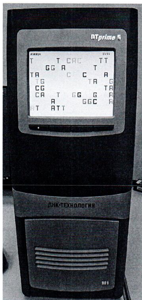
Рисунок 1.1 – Фотография общего вида амплификатора детектирующего ДТпрайм 5M1 № А5К815