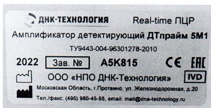
Рисунок 1.2 – Фотография маркировки амплификатора детектирующего ДТпрайм 5M1 № А5К815