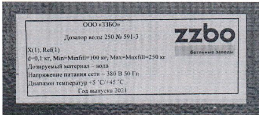
Рисунок 1.3 – Маркировка дозатора воды 250 № 591-3