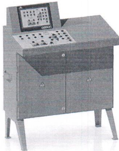
Рисунок 1.2 – Внешний вид устройства управления ПА-2.0