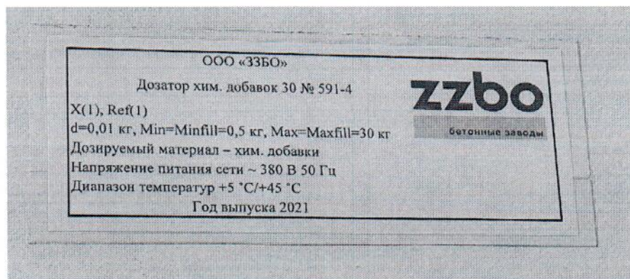
Рисунок 1.3 – Маркировка дозатора хим. добавок 30 № 591-4