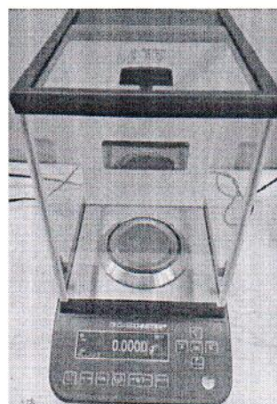
Общий вид модификаций ВЛА-xxx, ВЛА-xxxС, ВЛА-xxxС-О