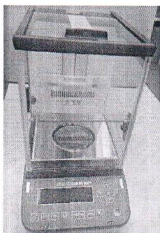
Общий вид модификации ВЛА-xxxМА (исполнение с автоматизированной витриной и регулируемым по высоте внутренним ветрозащитным экраном)