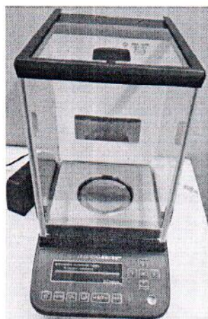
Общий вид модификации ВЛА-xxxМ