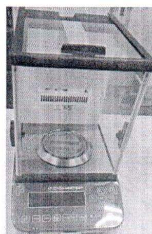
Общий вид модификаций ВЛА-220С-ОА, ВЛА-320С-ОА (исполнение с автоматизированной витриной)