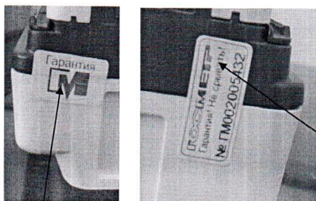
Схема пломбирования контрольными этикетками