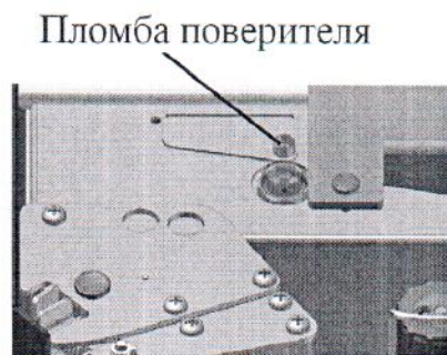
Индексы: СЗ; СЗМ (вид при поднятой платформе ГПУ)