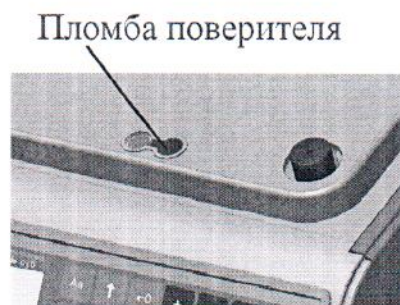
Индексы: В; ВМ; ВК; ВКМ (вид при снятой платформе ГПУ)