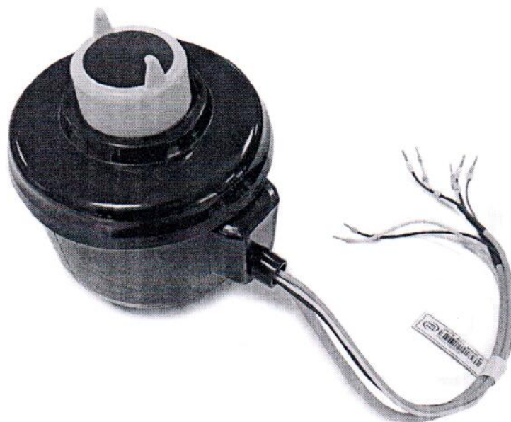
Рисунок 1 - Общий вид КДТН