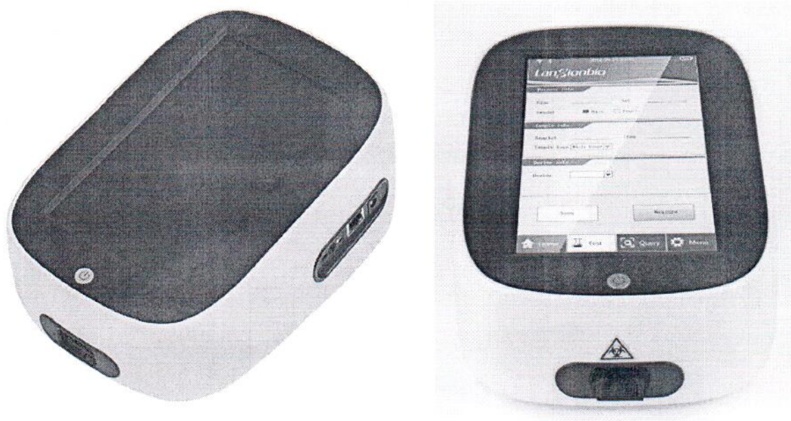
Рисунок 1.1 – Фотографии общего вида экспресс-анализаторов иммунофлуоресцентных портативных LS-1100