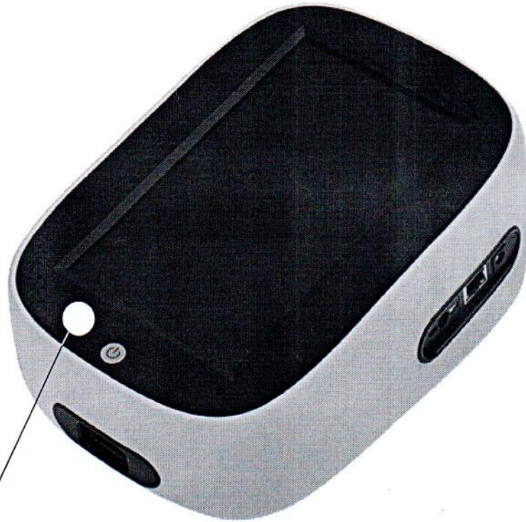
Схема с указанием места для нанесения знака поверки средств измерений

Место для нанесения знака поверки (клеймо-наклейка)