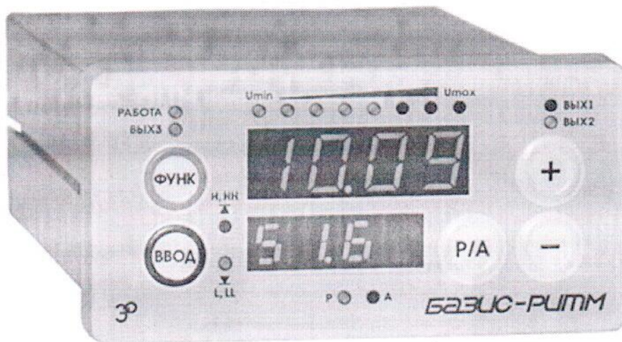
Рисунок 1 – Общий вид БАЗИС-РИТМ

Общий вид БАЗИС-РИТМ показан на рисунке 1.