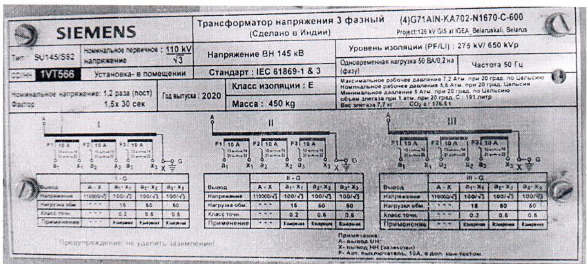
Рисунок 1.2 – Фотография маркировки трансформатора напряжения SU145/S92 № 1VT566