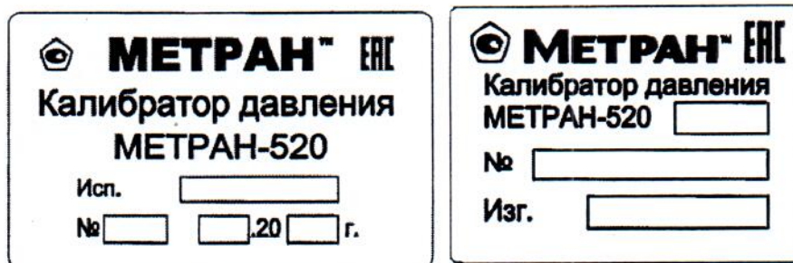
Рисунок 2 – Место нанесения знака утверждения типа и заводского номера