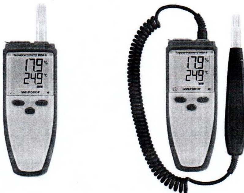
Рисунок 1 - Общий вид термогигрометра автономного ИВА-6Н (слева) и термогигрометров автономных ИВА-6А и ИВА-6Н, оснащенных удлинительным кабелем КУ-1 (справа)

Однозначная идентификация каждого экземпляра термогигрометра осуществляется по изготовленной печатным способом наклейке, располагаемой на обратной стороне термогигрометра. Наклейка содержит номер типа средства измерений в Федеральном фонде по обеспечению единства измерений, исполнение и модификацию термогигрометра и его заводской номер. Общий вид термогигрометров различных модификаций представлен на рисунке 1.