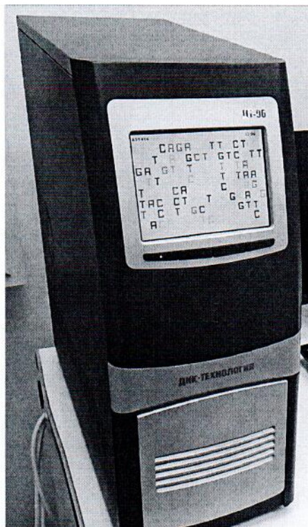
Рисунок 1.1 – Фотография общего вида амплификатор детектирующий ДТ-96 № А5У406