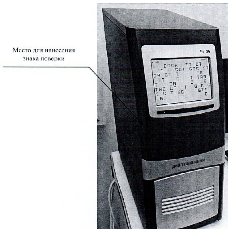
Рисунок 2.1 – Схема (рисунок) с указанием места для нанесения знака поверки

Схема (рисунок) с указанием места для нанесения знака поверки средств измерений