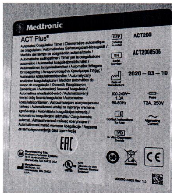
Рисунок 1.2 – Фотография маркировки автоматического таймера коагуляции ACT Plus № ACT2008506