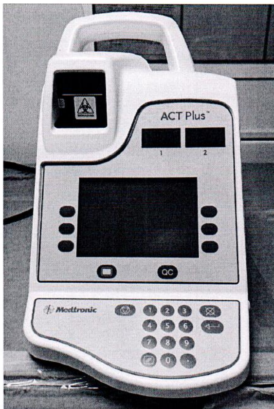
Рисунок 1.1 – Фотография общего вида автоматического таймера коагуляции ACT Plus № ACT2008506