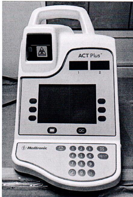
Рисунок 1.1 – Фотография общего вида автоматического таймера коагуляции ACT Plus № ACT2008679