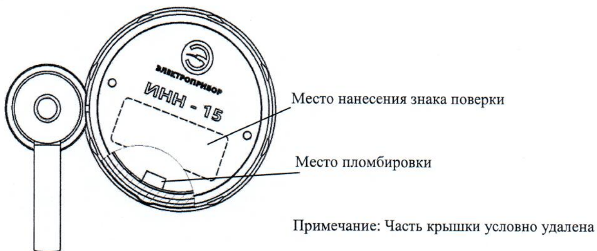
Рисунок 1– Внешний вид рабочей части с блоком индикации со стороны крышки с указанием места пломбировки

Внешний вид рабочей части с блоком индикации со стороны крышки с указанием места пломбировки представлен на рис. 1. Внешний вид измерителей представлен на рис.2.