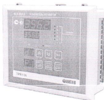
Рис.1 Общий вид приборов в корпусе «Щ4» Рис.2 Общий вид приборов в корпусе «Щ7»