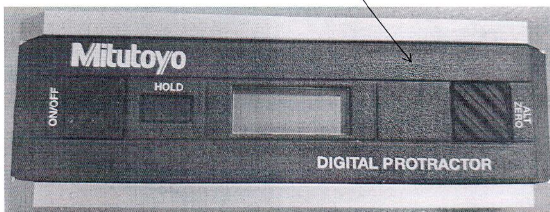
Рисунок 2.1 - Схема (рисунок) с указанием места для нанесения знака поверки для прибора цифрового прецизионного Pro 3600 № 23010138