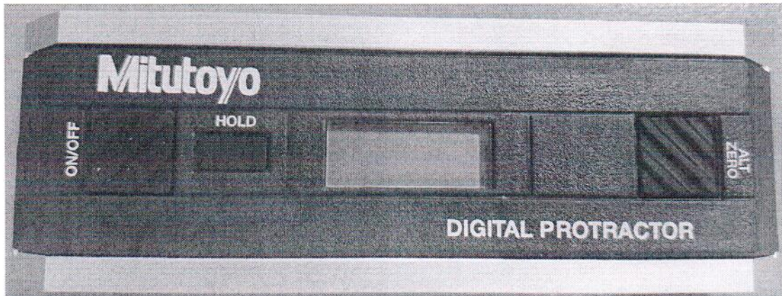
Рисунок 1.1 - Общий вид прибора цифрового прецизионного Pro 3600 № 23010138