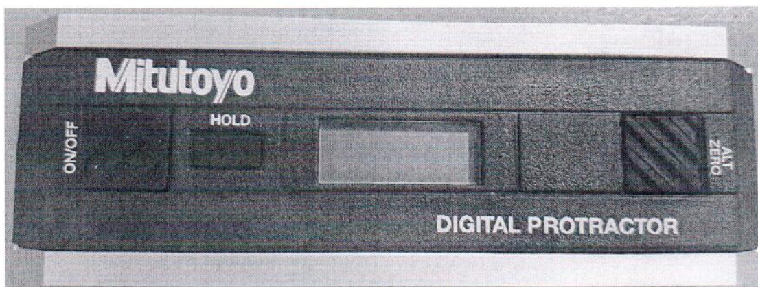
Рисунок 1.1 - Общий вид прибора цифрового прецизионного Pro 3600 № 23010139