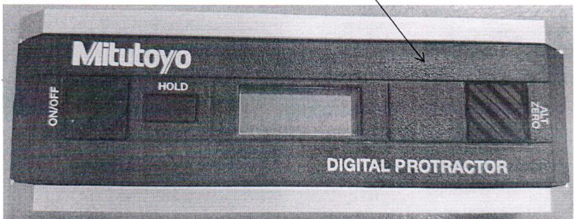
Рисунок 2.1 - Схема (рисунок) с указанием места для нанесения знака поверки для прибора цифрового прецизионного Pro 3600 № 23010139