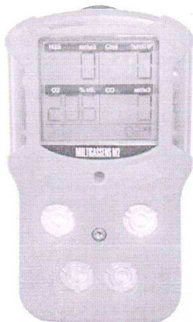
Рисунок 1 – Общий вид газоанализаторов МУЛЬТИГАЗСЕНС-М2

Общий вид газоанализаторов, схема пломбировки от несанкционированного доступа представлены на рисунках 1, 2.