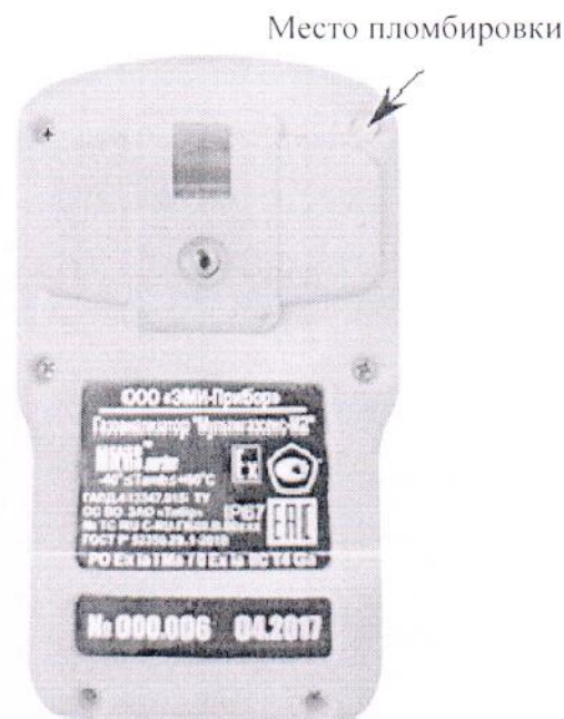
Рисунок 2 – Схема пломбировки от несанкционированного доступа МУЛЬТИГАЗСЕНС-М2