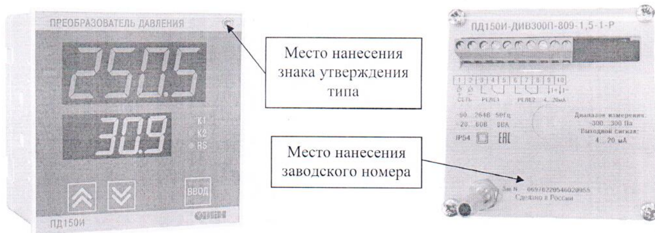
Рисунок 2 - Общий вид преобразователей давления ПД150И с типом корпуса 809 (щитовое крепление) с указанием мест нанесения знака утверждения типа и заводского номера

Нанесение знака поверки на преобразователи не предусмотрено. Пломбирование преобразователей не предусмотрено.