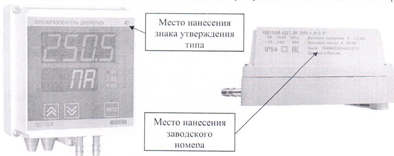
Рисунок 3 - Общий вид преобразователей давления ПД150И с типом корпуса 899 (настенное крепление)