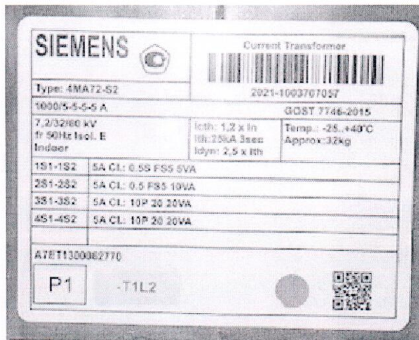
Рисунок 1.2 – Фотография маркировки трансформатора тока 4MA72-S2 АУС № 1003707057