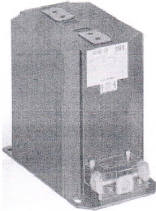
Рисунок 1.1 – Фотография общего вида трансформатора тока 4MA72-S2 АУС № 1003707057

Фотографии общего вида средства измерений