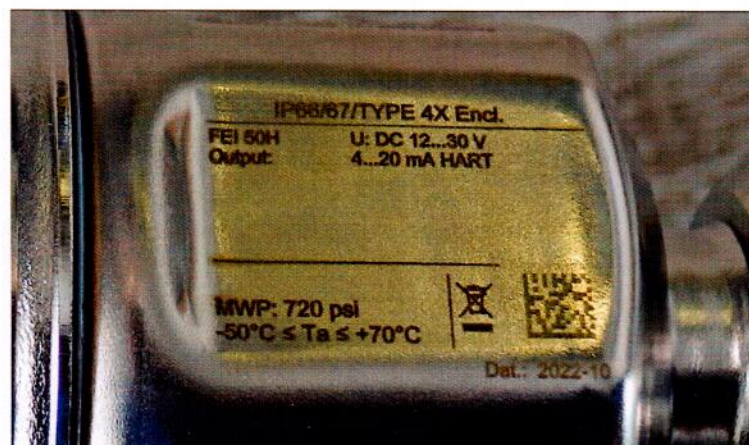
Рисунок 1.3 – Фотографии маркировки уровнемера