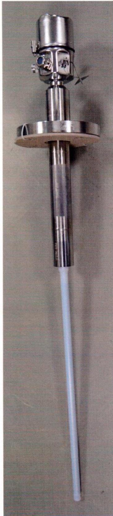
Рисунок 1.1 – Фотография общего вида уровнера