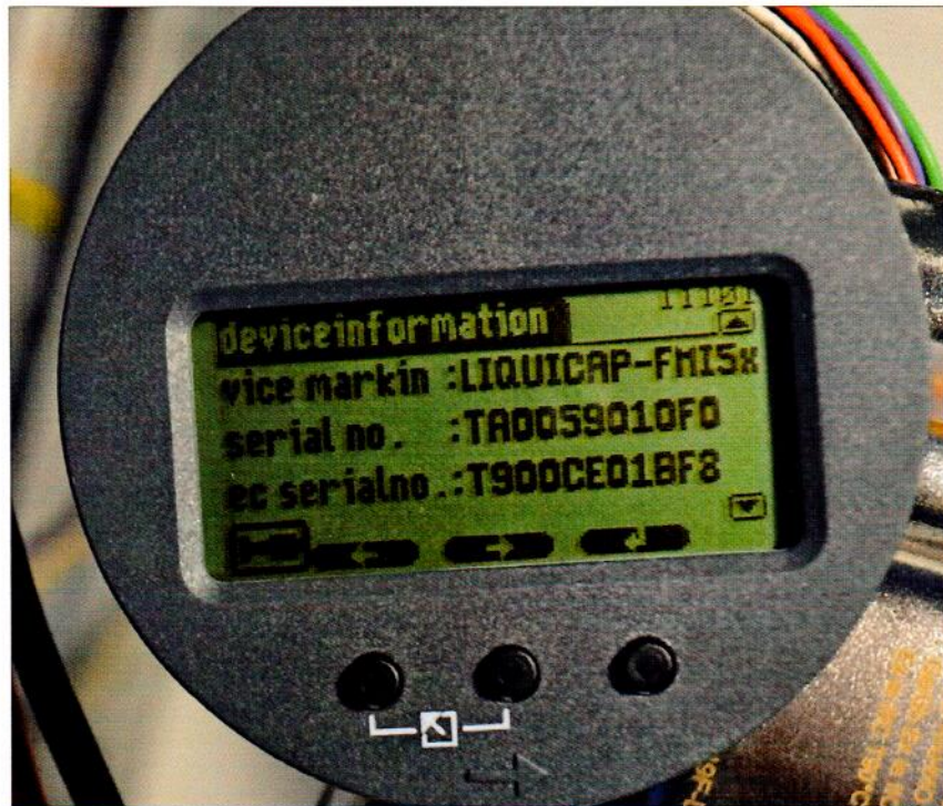
Рисунок 1.2 – Фотография общего вида встроенного цифрового дисплея уровнемера