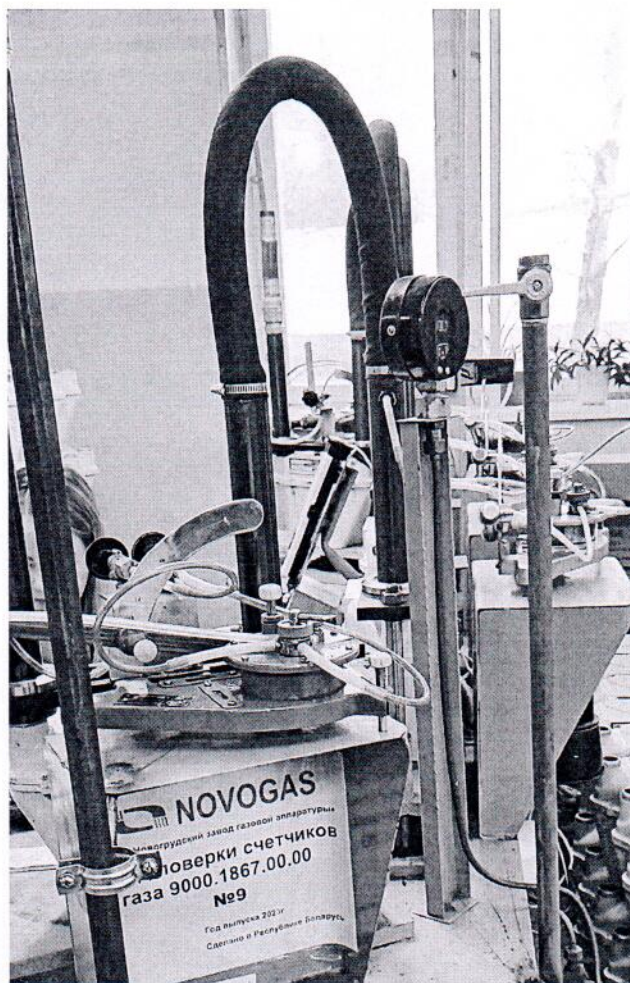
Рисунок 1.1 – Фотографии общего вида стенда поверки счетчиков газа 9000.1867.00.00 № 9