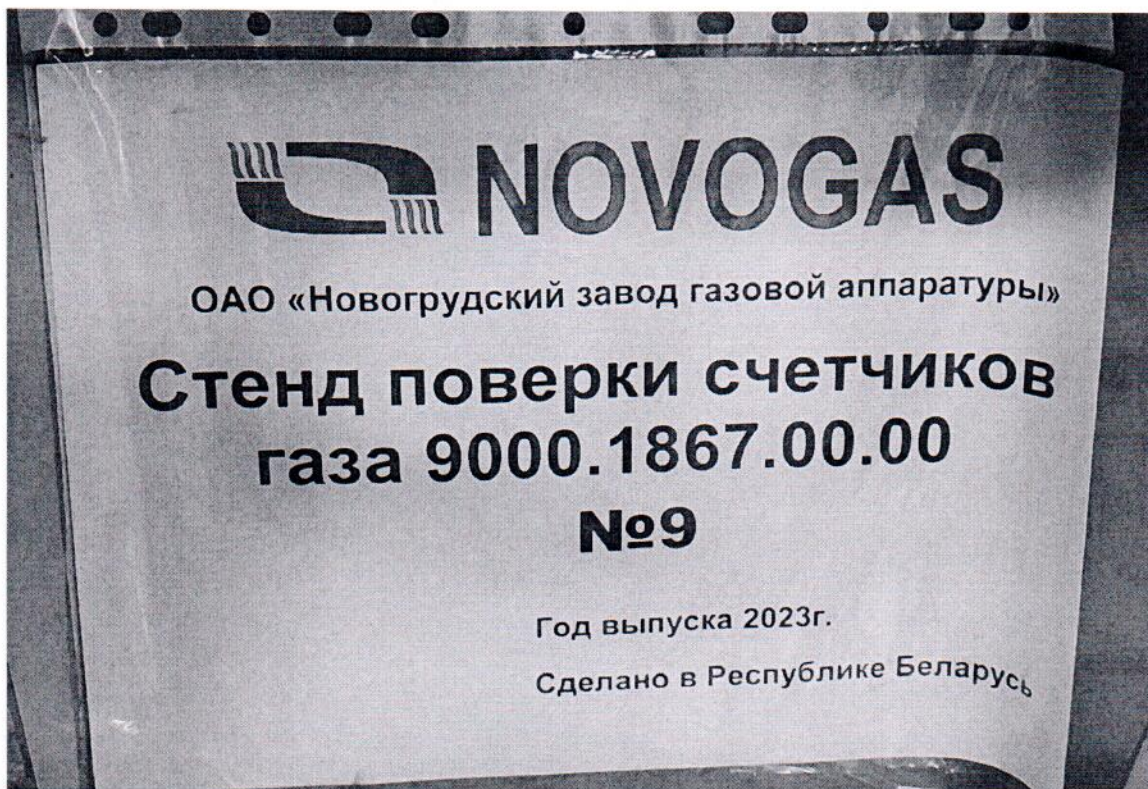
Рисунок 1.2 – Фотография маркировки стенда поверки счетчиков газа 9000.1867.00.00 № 9