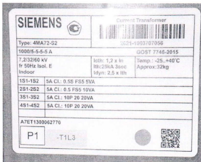
Рисунок 1.2 – Фотография маркировки трансформатора тока 4MA72-S2 АУС № 1003707056