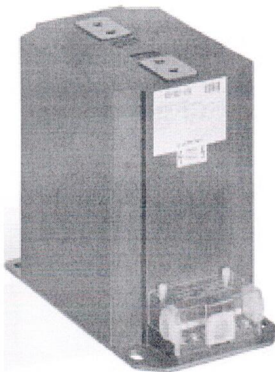
Рисунок 1.1 – Фотография общего вида трансформатора тока 4MA72-S2 АУС № 1003707056

Фотографии общего вида средства измерений