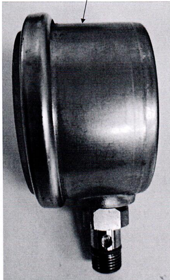
Рисунок 2.1 – Схема (рисунок) с указанием места для нанесения знака поверки средств измерений

Место для нанесения знака поверки средств измерений