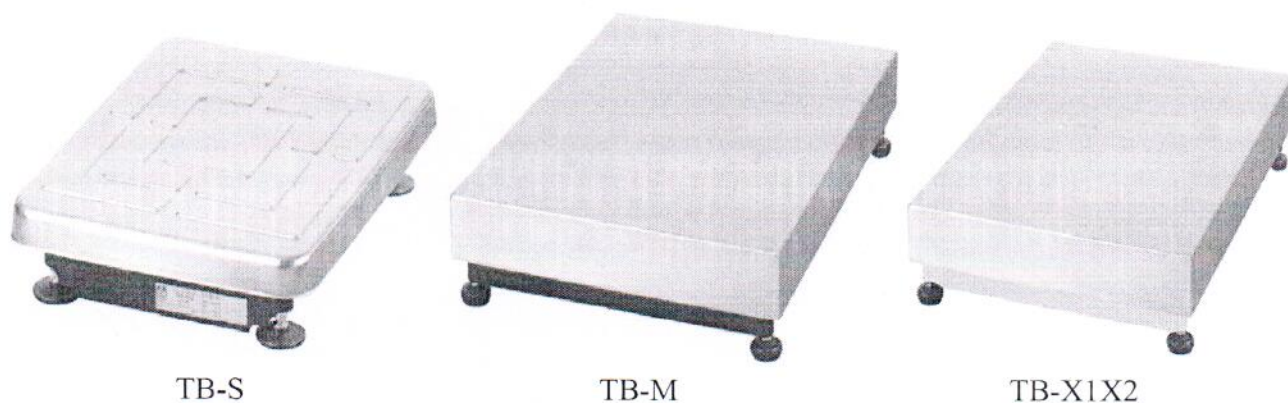
Рисунок 1 - Варианты исполнения грузоприёмной платформы

Варианты исполнения модуля отличаются габаритными размерами, массой, формой грузоприемной платформы и материалом из которых изготовлены основание и корпус.