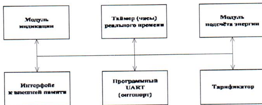
Рисунок 3 - Структура программного обеспечения «Меркурий 206»

Программное обеспечение состоит из следующих модулей: