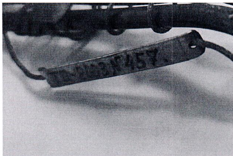
Рисунок 1.2 – Фотография маркировки приемника теплового потока охлаждаемого ТП-2003 № 457