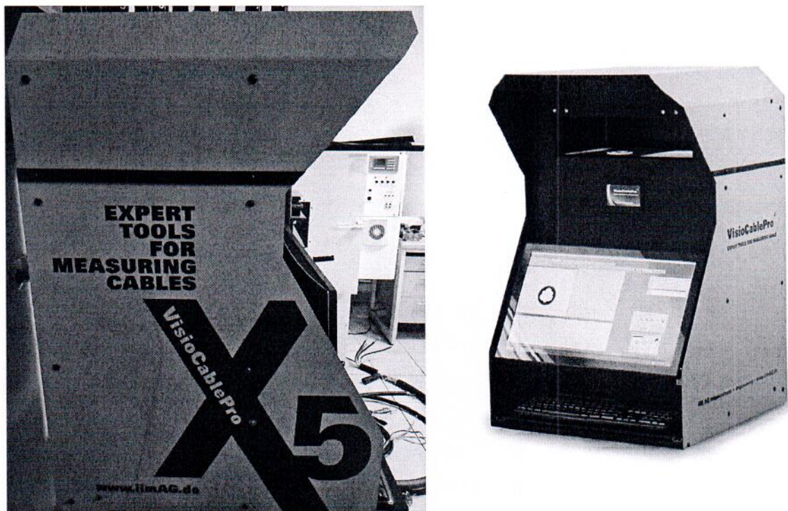
Рисунок 1.1 – Фотографии общего вида прибора для измерения геометрических параметров кабеля VisioCablePro VCPX5 № VCPX52202306