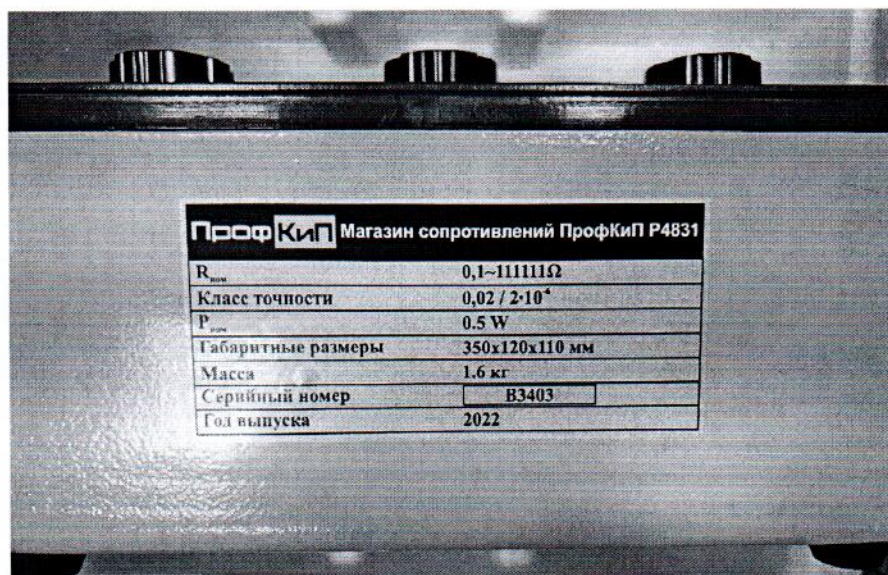
Рисунок 1.1 – Внешний вид магазина сопротивлений ПрофКиП Р4831 № В3403