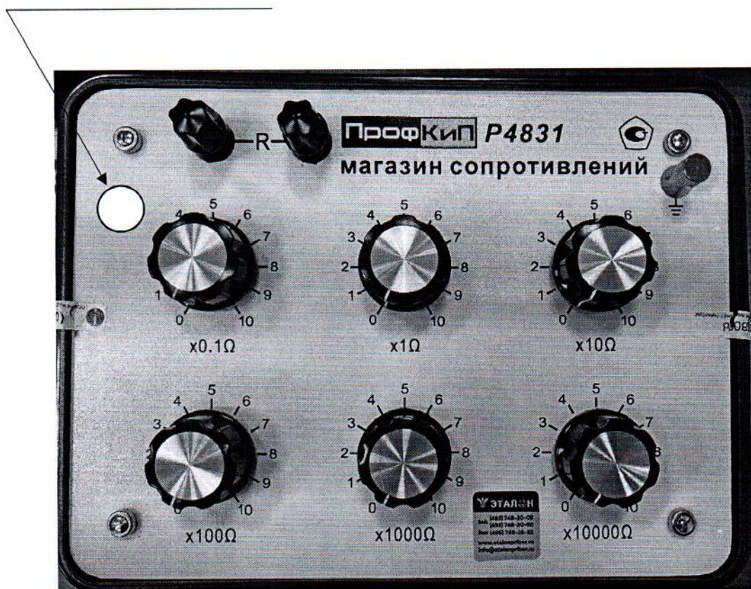
Рисунок 2.1 – Место нанесения знака поверки магазина сопротивлений ПрофКиП Р4831 № В3403

место для нанесения знака поверки в виде клейма-наклейки